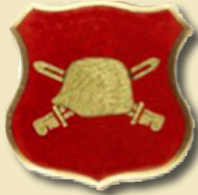
Distintivo según Reglamento de Vestuario y Equipo para Oficiales, edición 2002.