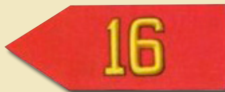
Lámina extraída de “Historia del Ejército de Chile”, Tomo XI “Nuestros Uniformes”.

Reglamento de Uniformes para Oficiales del Ejército, Nº 25, edición de 1919.