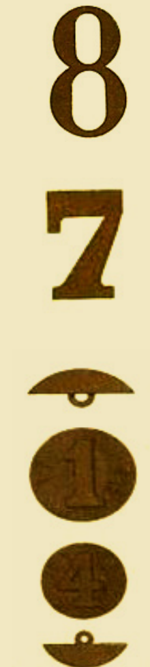
Láminas Ilustrativas del Reglamento de Uniforme para el Ejército (4 de agosto de 1892). Kepí, Cuello y botones.

Sin embargo, la descripción no indica un distintivo específico como arma. Una distinción en los uniformes la encontramos en el decreto del 14 de octubre de 1826, donde se señaló que el uniforme para infantería será “casaca recta de paño azul, vivos encarnados, dos estrellas sencillas en los faldones para las compañías de fusileros, granadas de ordenanza para las de granaderos y cornetas por el mismo orden para las de cazadores con arreglo a los métodos que se presentarán por el Ministerio