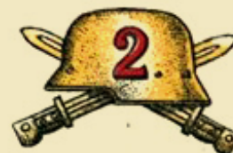
REGIMIENTO DE INFANTERIA

En 1930, específicamente el 23 de enero se aprobó el “Reglamento de Vestuario y Equipo para la Tropa”, Serie 5, en el cual se establece el emblema del Ejército de la República, debiendo llevar todas las tropas en el cubre cabeza “un escudo nacional de metal pavonado de 2 centímetros de alto y ancho”. Luego, se agrega que los distintivos de armas y servicios consistirán en parches de paño que llevarán en el cuello de la blusa, lo que debían ser del color distintivo del arma o servicio y sin vivos. “Tendrán forma rectangular, 3 centímetros de alto por 7 de largo, terminando en un ángulo agudo hacia atrás de 3 centímetros de desarrollo”. Cabe señalar que con esta disposición, el rojo quedó nuevamente como color distintivo de la infantería y de otras reparticiones, especificando que la infantería usará