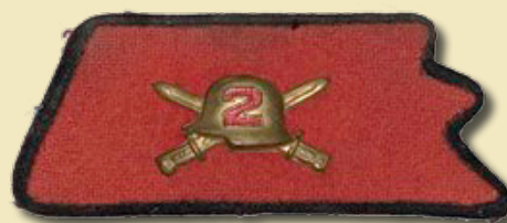
Insignia en el reglamento y su versión realizada en metal sobre el parche del arma.

como insignias los números de los regimientos, en tanto que las escuelas de las armas llevarán las iniciales, en caso de la Escuela de la Infantería “E.I.”.