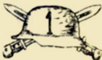
Forma del parche e insignia. Reglamento de vestuario y Equipo, edición de 1939.