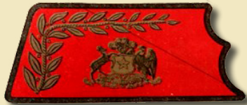
Distintivos según Reglamento de Vestuario y Equipo para Oficiales, edición de 1949.