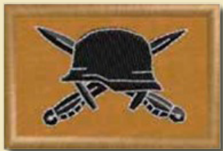
Insignia del Arma de Infantería desde el año 2016..

Entre las modificaciones se señalaba que las insignias de metal que se llevarían en parches de las blusas de paño y loneta y en las palas del capote, debían ser doradas para el Arma de Infantería, igual que el escudo de la gorra. Cabe señalar que, además, se usaron monogramas para las reparticiones militares.