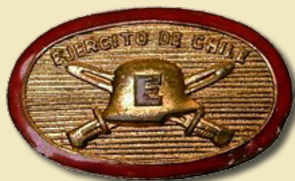
Distintivo Infantería, 1941.

collarín de la levita o casaca será en delante de metal dorado, de veinte milímetros de alto, sin laurel que actualmente encierra, debiendo usarse únicamente en el cuello i suprimirse en el quepí o gorra...". Dos décadas después, en octubre de 1878, se ordenó que el uniforme de tropa de infantería sería de "levita azul negro con vivos lacres en el cuello, solapa, bocamangas i carteras posteriores [...] llevarán a cada lado el número del batallón, de paño amarillo de una altura de veinticinco milímetros..." y botones de metal amarillo, con el número correspondiente al cuerpo.