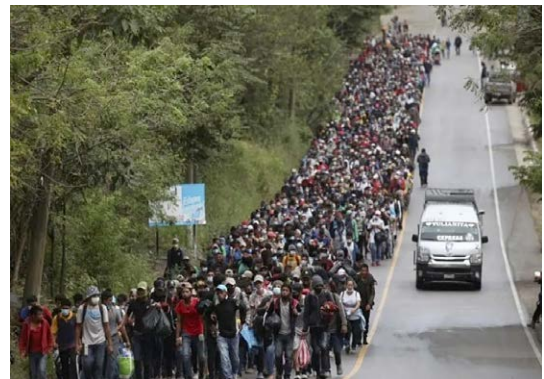
Figura Nº 7: Columna de migrantes centroamericanos

o barcos menores, arrendados, sean espontáneas como producto de la desesperación familiar o individual o producto del derecho humano a migrar. Tiene toda la forma de una acción concertada para generar un efecto político en un conflicto político; en este caso específico de las columnas centroamericanas, se formaron contra “el muro” del presidente Trump y hoy contra el presidente Joe Biden y su política migratoria. Hay en estos actos y en particular en la columna de la figura de referencia, una intencionalidad política que en su bajada de título o descripción original se representa como “la mayor (columna) conformada este año, y coincide con el desarrollo esta semana (junio 2022), de la Cumbre de las Américas, la cita que reunirá a representantes de países del continente en Los Ángeles para hablar, entre otras cosas, de cómo gestionar de forma conjunta los crecientes flujos migratorios. 33