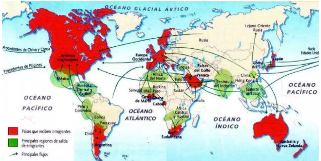
Figura Nº 2: Principales flujos migratorios a fines del siglo XX y principios del XXI.

turco transcrita el 30 de diciembre de 2019 por el medio DW.com, filial de la cadena internacional Deutsche Welle para Latinoamérica: