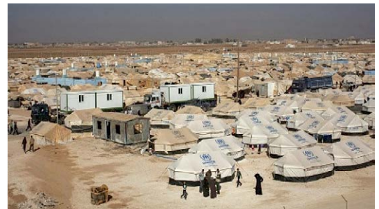
Figura Nº 3: Campamentos de refugiados sirios en la frontera de Turquía

inicialmente seis mil millones de euros destinados a mejorar las condiciones de vida de los refugiados.