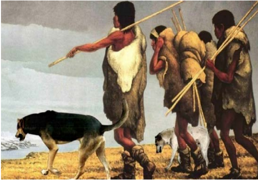
Figura N° 1: Flujos migratorios