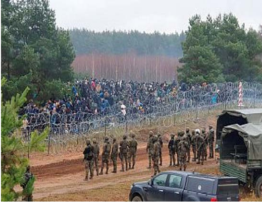
Figura Nº 6: Crisis migratoria frontera Bielorrusia con Polonia.

Autoridades de Occidente creen que el gobierno bielorruso ha enviado los migrantes a la frontera en respuesta a sanciones internacionales que recibió por abusos a los derechos humanos. 30