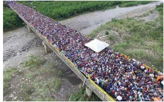
Figura Nº 4: Avalancha migratoria venezolana.

Junto con ello, el mundo comienza a ampliar su dimensión al desarrollarse internet y multiplicar la información de lo que sucede en otras partes del planeta que se convierten en atractivas para muchos grupos humanos.