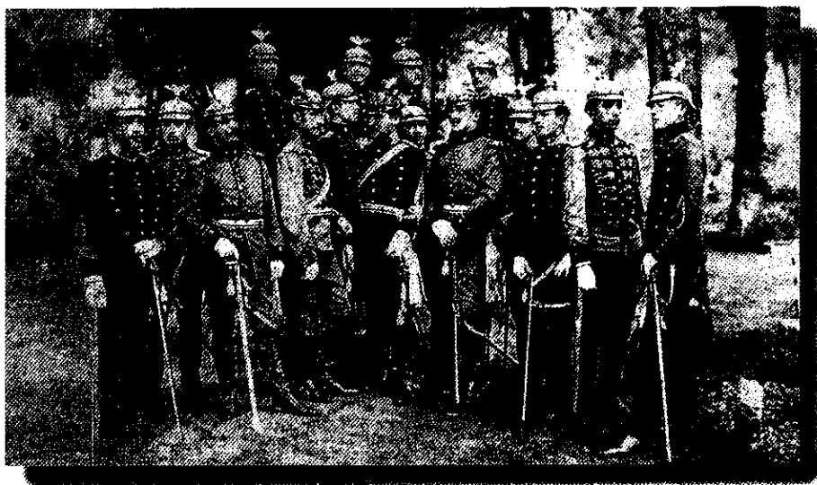
Oficiales chilenos y ecuatorianos en Quito, 1904.