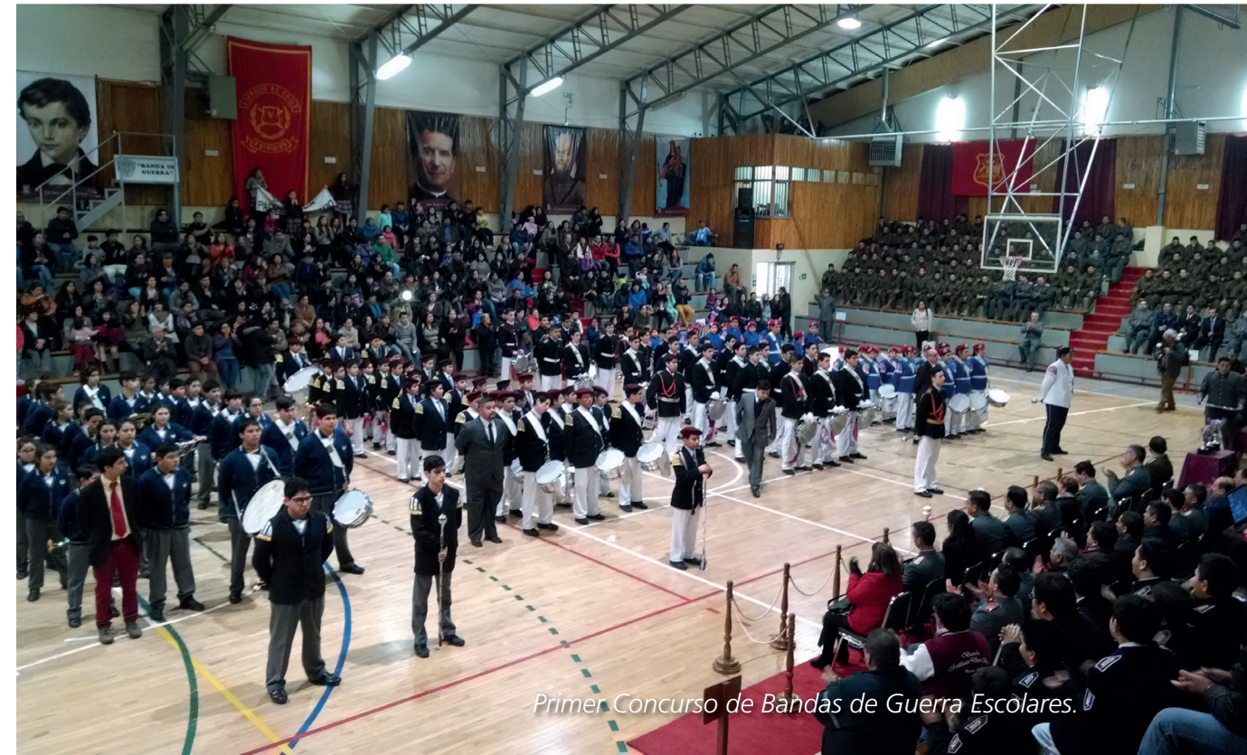
Primer Concurso de Bandas de Guerra Escolares.