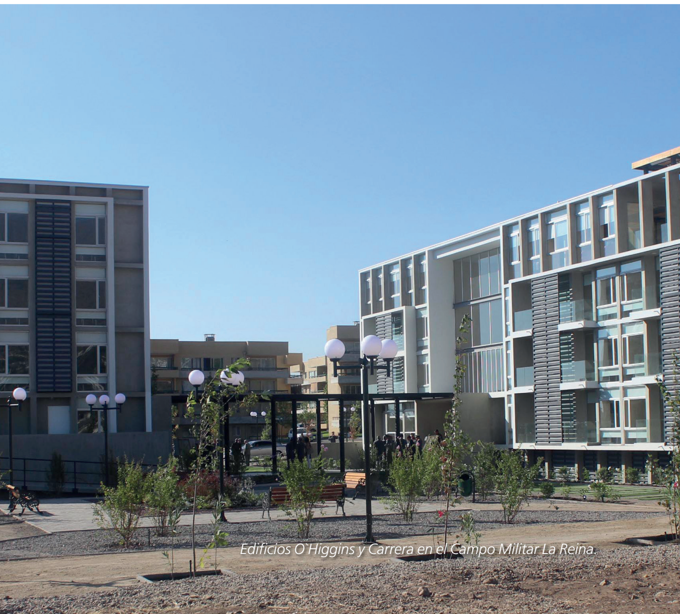
Edificios O'Higgins y Carrera en el Campo Militar La Reina.

los edificios O'Higgins y Carrera en el Campo Militar La Reina, destinado a oficiales; además, se inició la construcción de una torre de departamentos en la "Villa Militar del Este", se construyó un casino para oficiales solteros en Arica, se repararon 44 cabañas, cuatro pabellones de solteros y ocho cuadras de soldados en diversas unidades a lo largo del país, mejorando en forma importante la calidad de vida del personal institucional. Paralelamente, se ha readecuado y mejorado la habitabilidad de los ranchos centralizados, clubes e instalaciones de bienestar para el personal de planta, tornándolos más inclusivos y sustentables. En búsqueda de las mejores soluciones habitacionales para el personal institucional, la Jefatura de Ahorro para la Vivienda del Ejército (JAVE), ha implementado políticas destinadas a incentivar a sus miembros a participar del sis-