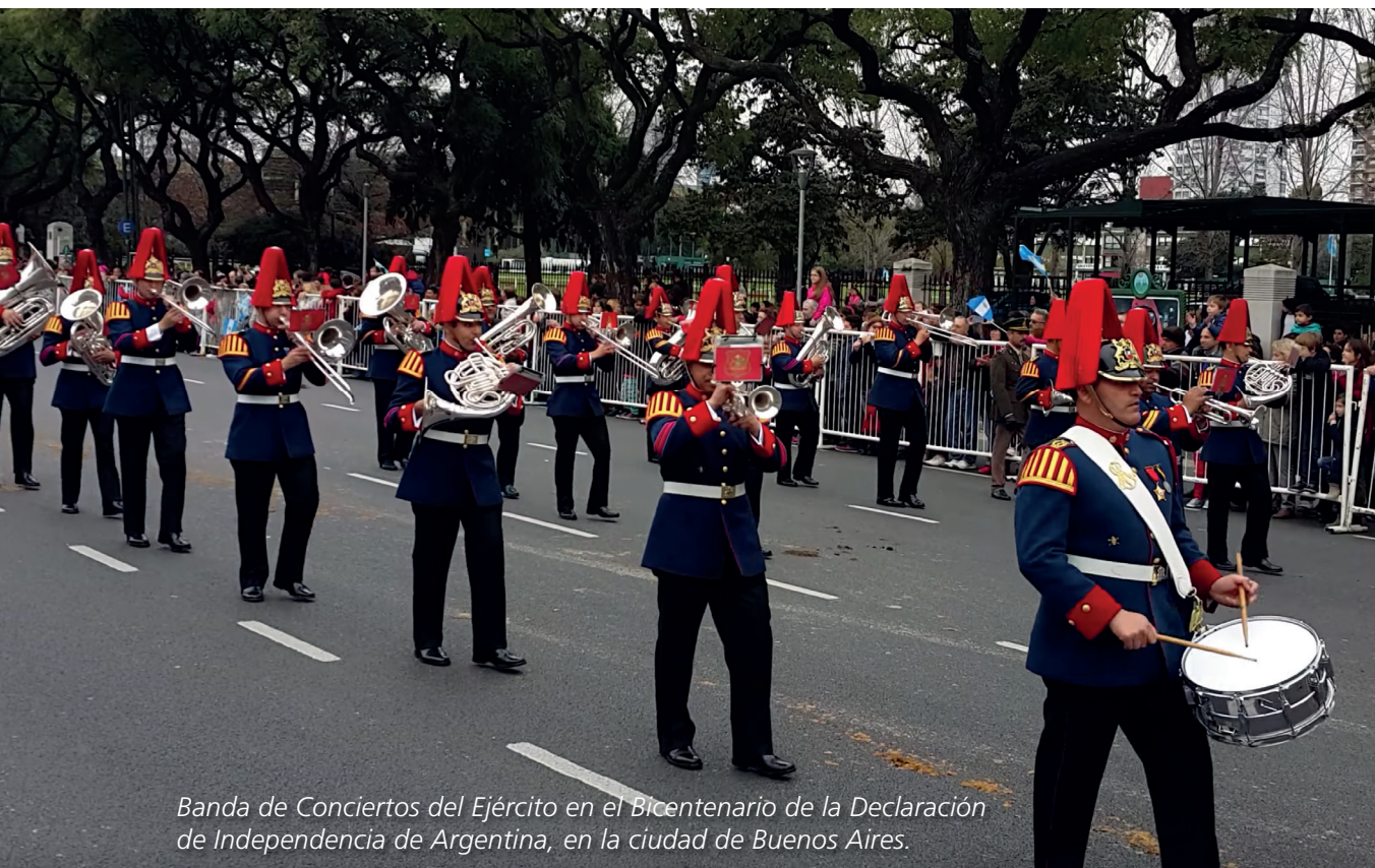
Banda de Conciertos del Ejército en el Bicentenario de la Declaración de Independencia de Argentina, en la ciudad de Buenos Aires.