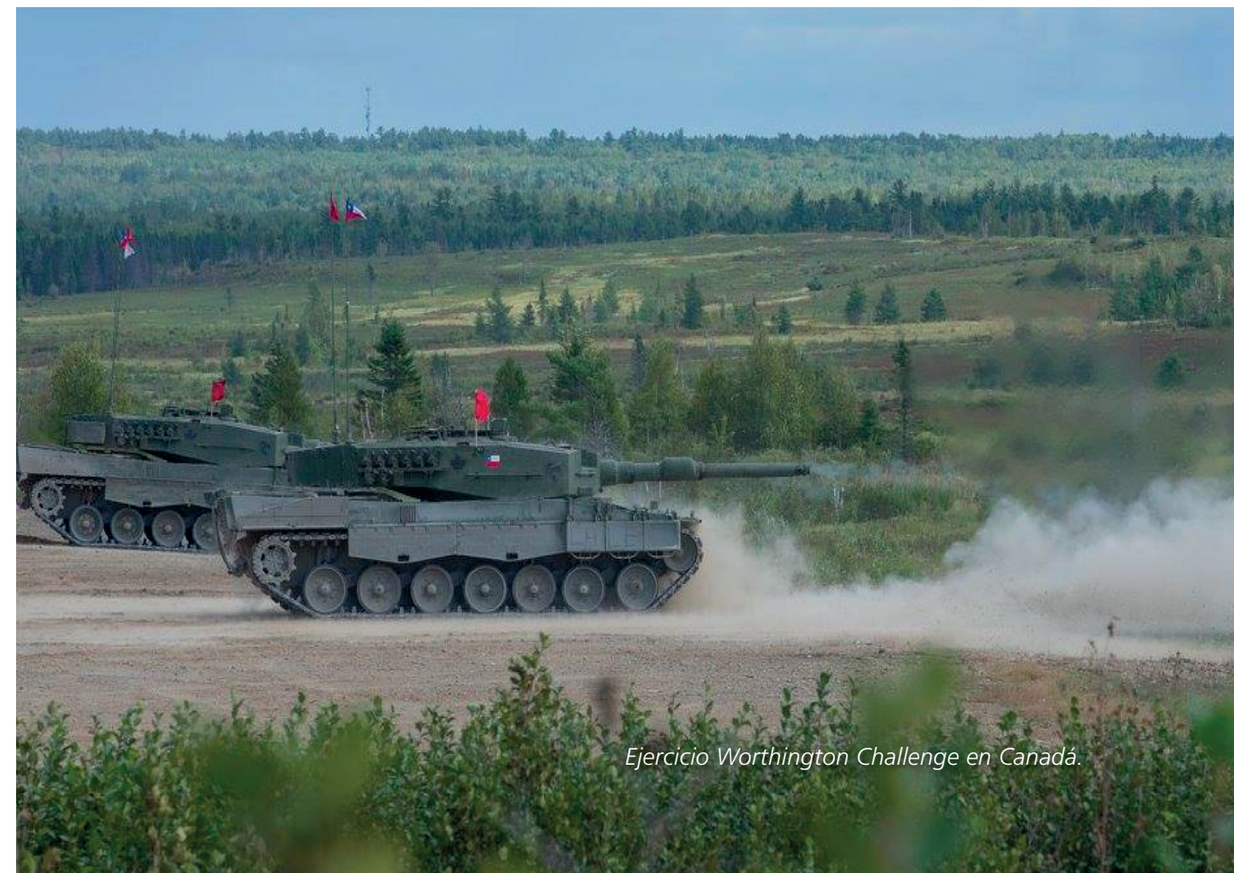
Ejercicio Worthington Challenge en Canadá.

En la Escuela de los Reales Cuerpos Acorazados de Canadá se realizó el Ejercicio Worthington Challenge, con el fin de conocer y evaluar las habilidades de las tripulaciones de vehículos acorazados, como también, incrementar el nivel de interoperabilidad con aliados, esperando, de esta manera, aumentar el espíritu de cuerpo de dichos efectivos. Para la selección de los representantes de nuestra institución, se realizó una competen-