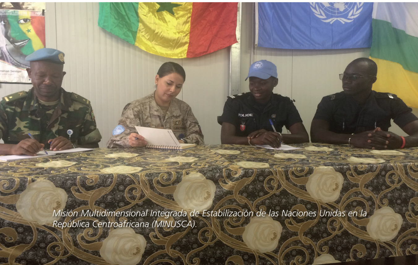
Misión Multidimensional Integrada de Estabilización de las Naciones Unidas en la República Centroafricana (MINUSCA).

Por otra parte, con respecto a la violencia intrafamiliar, flagelo de la sociedad del que no se encuentra libre el Ejército, el año 2015 la institución publicó la cartilla "Procedimientos ante hechos de violencia intrafamiliar a nivel institucional" con el objetivo de orientar a los mandos y transparentar la forma de abordar esta problemática por medio de un procedimiento estandarizado que permita educar, prevenir y promover el cambio cultural que se requiere para disminuir la ocurrencia de estos hechos, continuándose el año 2016 con la difusión de estas materias con el fin de capacitar a los mandos y a los especialistas de la salud y de apoyo al personal, quienes como agentes replicadores del conocimiento, recibieron información y preparación en la implementación de los procedimientos institucionales, incluyendo el tema en la Academia de Guerra en el módulo "Ejército" para alumnos de III año y en el curso de Informaciones de los Servicios mencionados "personal". Además, se distribuyó una guía de bolsillo, material de apoyo práctico para la aplicación de los procedimientos ante este tipo de hechos que afecten a nuestro personal, entre otras actividades.